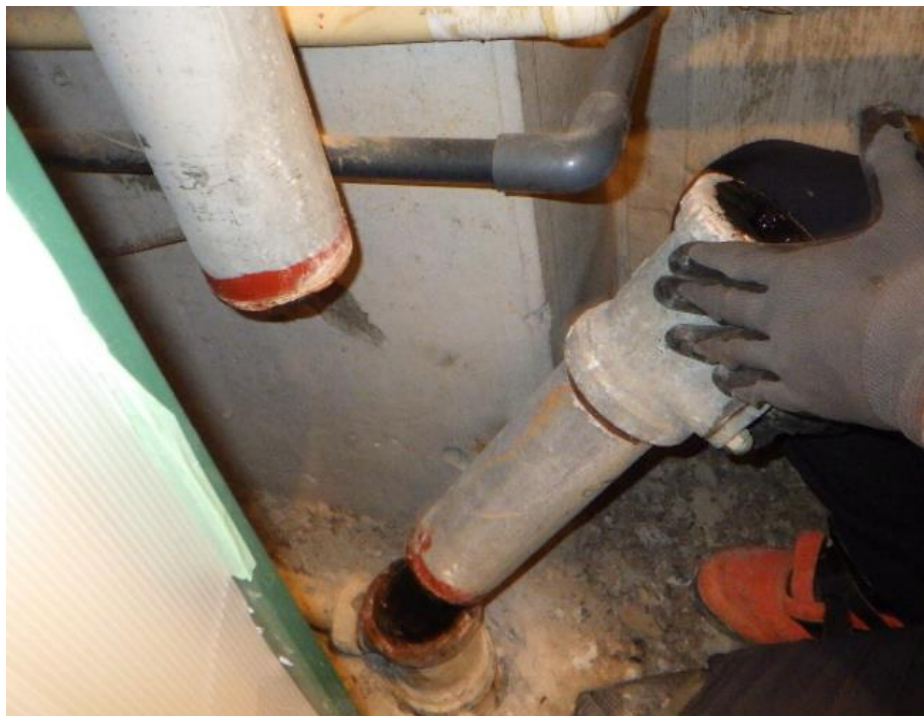
共用立管（雑排水管）