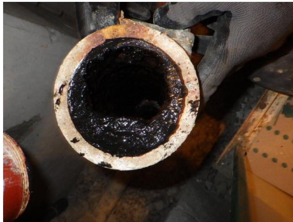
雑排水管（同左拡大）