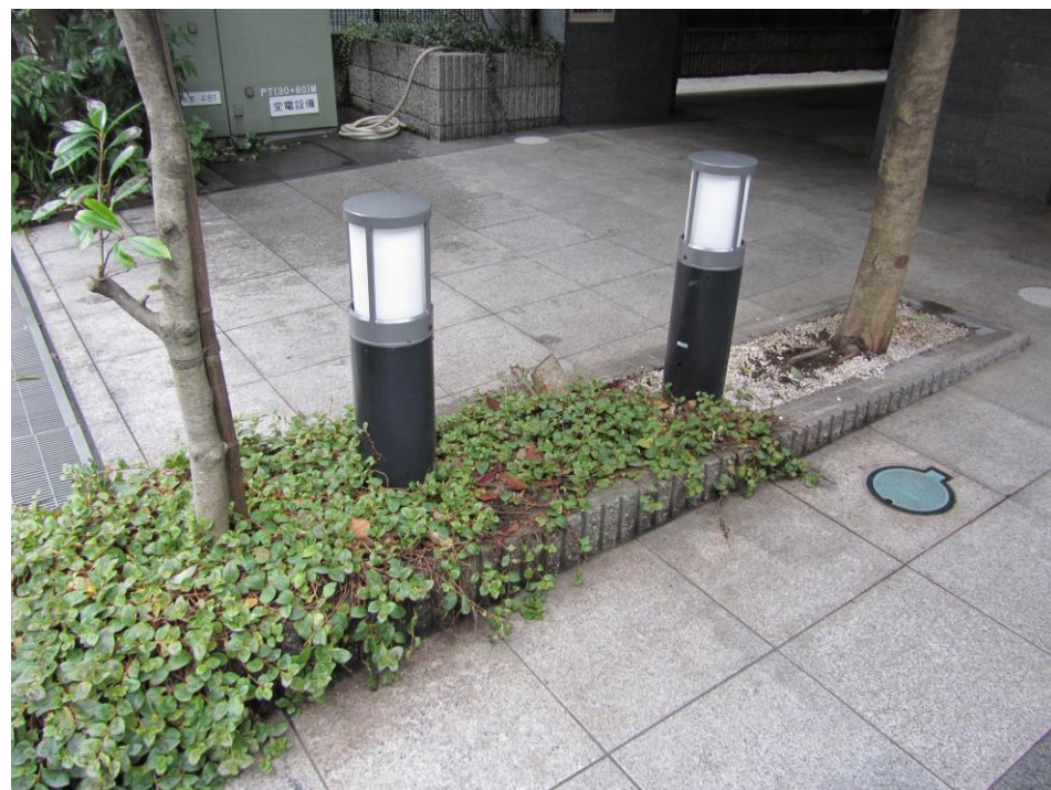
LED化工事を行った庭園灯